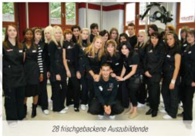
28 frischgebackene Auszubildende

So ein Einstieg in den neuen Ausbildungsberuf erleichtert den Start